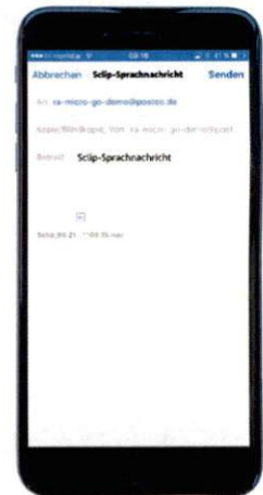
Versand des Sclips per E-Mail