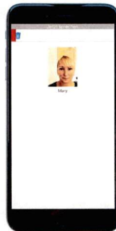
Aufnahme mit ausgewähltem Einzelkontakt