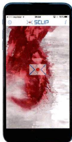
Sclip Startscreen Art-Cover