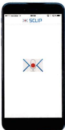
Sclip Startscreen Standard-Cover

Daher empfehlen wir jedem Anwalt, insbesondere mit anwaltlichen Hilfskräften, probieren Sie Sclip in der Kommunikation mit der Kanzlei aus – Sie werden es bald in Ihrem Alltag nicht mehr missen wollen. Sclip ist völlig kostenlos und unabhängig vom Einsatz der RA-MICRO Kanzleisoftware.